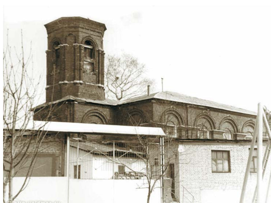
В советское время в здании церкви размещалась трикотажная фабрика "Родина"

Восстановление храма началось в 1991 году, когда его здание было передано православной общине.