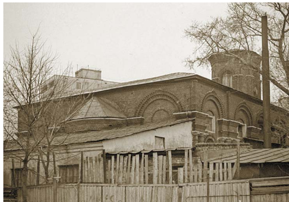
Снимок 1988 года