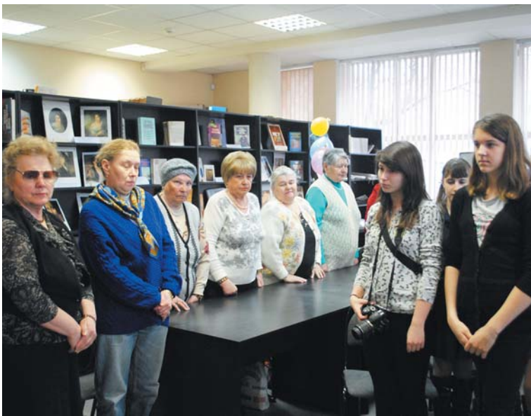
Светлой памяти павших. Минута молчания