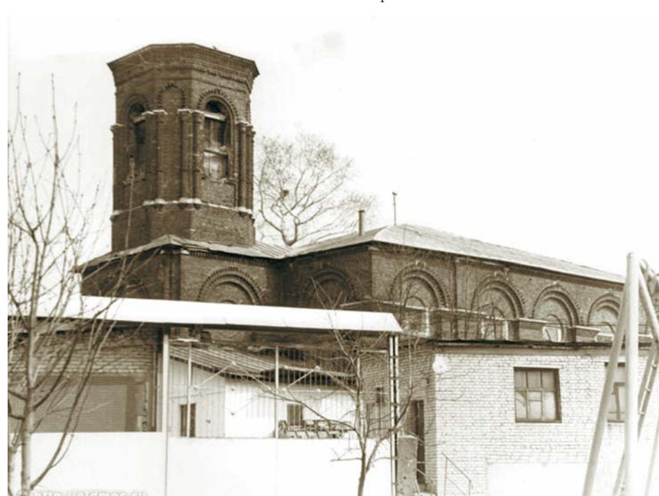
В советское время в здании церкви размещалась трикотажная фабрика "Родина"

Восстановление храма началось в 1991 году, когда его здание было передано православной общине.