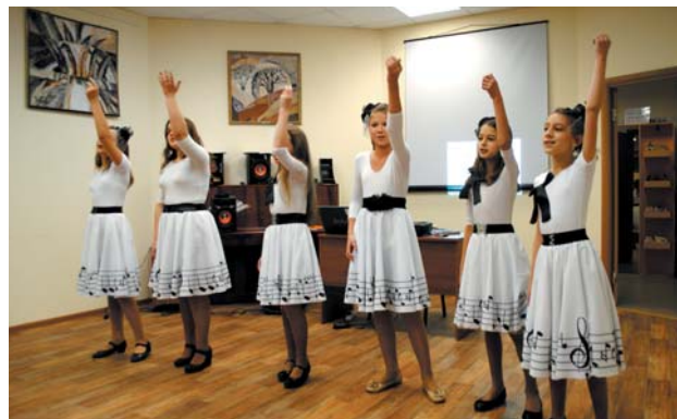
Свой подарок посетителям выставки приготовила студия "Ключ"