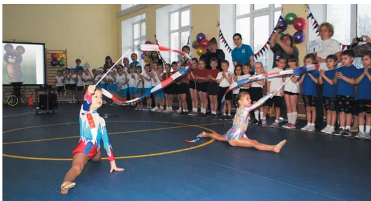
Спортсменов приветствовали юные гимнастки

И вот настал самый волнительный момент для всех - церемония награждения. Конечно, каждая команда старалась стать лучшей в тот день, но незбылем Олимпийский принцип - главное не победа, а участие. Поэтому все участники получили из рук представителя муниципалитета заветную медаль и статуэтку древнегреческой богини победы - Нику.